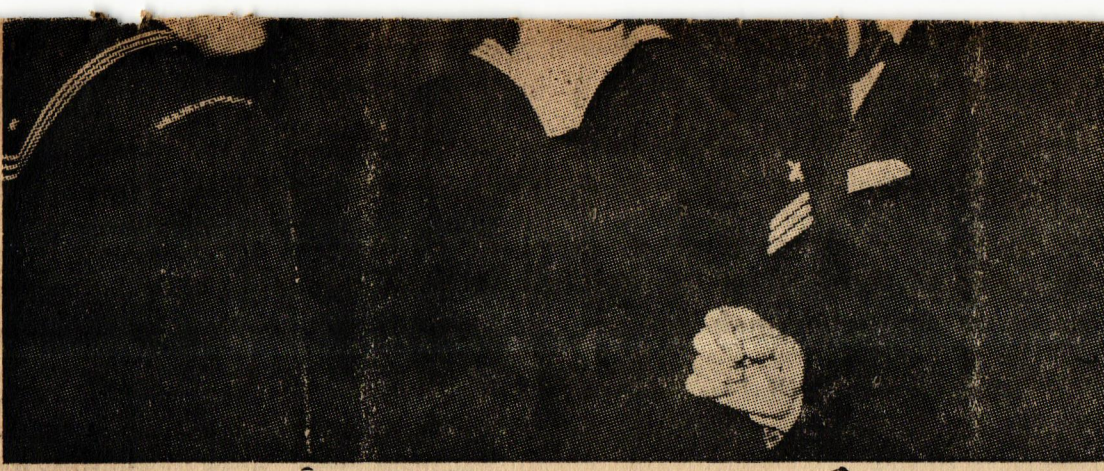
Genelev isteyen Amerikalılar...